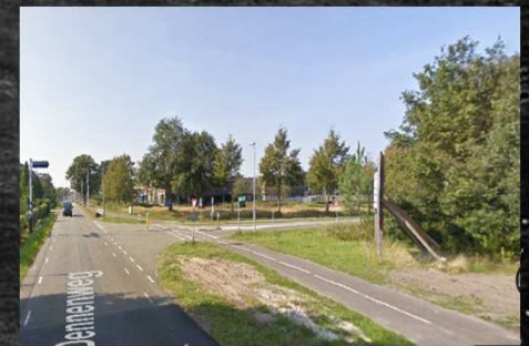
Kozijnenhoek (Munnikenheide college)