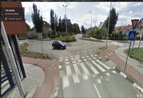
Rotonde St. Janstraat / Noorderstraat

Op dit stuk van de route kom je een aantal gevaarlijke straten van rechts tegen.